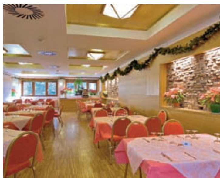
Hotel Club Regina e Fassa - quote per persona